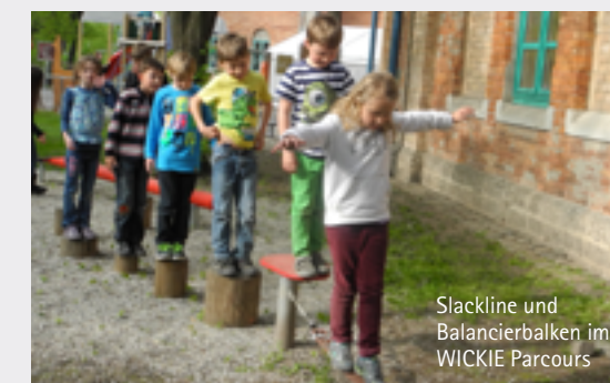
Slackline und Balancierbalken im WICKIE Parcours

Dauer: 30 Minuten. Hinweis: Die Aufsichtspflicht liegt bei der Lehrkraft bzw. bei dem Erziehungsberechtigten!