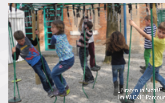
„Piraten in Sicht!“ im WICKIE Parcours